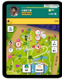
iPad mini - 768