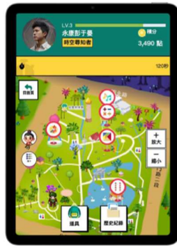
iPad Air - 820